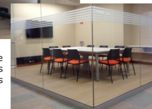
Proyecto: Universidad de los Andes

Líneas de estaciones de trabajo que permiten innumerables combinaciones según las necesidades específicas del cliente.