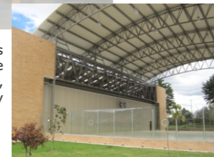
Proyecto: Polideportivo Escuela Colombiana de Ingeniería Julio Garavito. Serie 641, STC 54

Divisiones móviles con la más avanzada acusticidad, sistemas de rodadura omnidireccionales, protección contra incendios y facilidad de accionamiento.