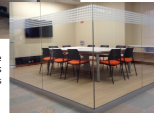
Proyecto: Universidad de los Andes

Líneas de estaciones de trabajo que permiten innumerables combinaciones según las necesidades específicas del cliente.