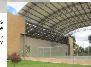
Proyecto: Polideportivo Escuela Colombiana de Ingeniería Julio Garavito. Serie 641, STC 54

Divisiones móviles con la más avanzada acusticidad, sistemas de rodadura omnidireccionales, protección contra incendios y facilidad de accionamiento.