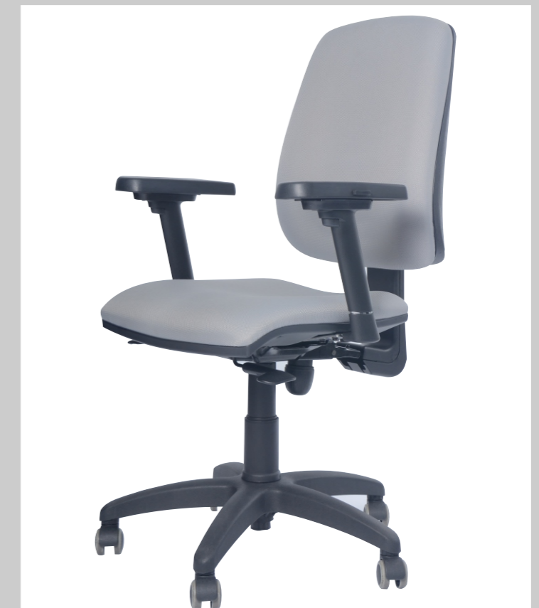
QS 800 AR/BA4 Asiento Especial