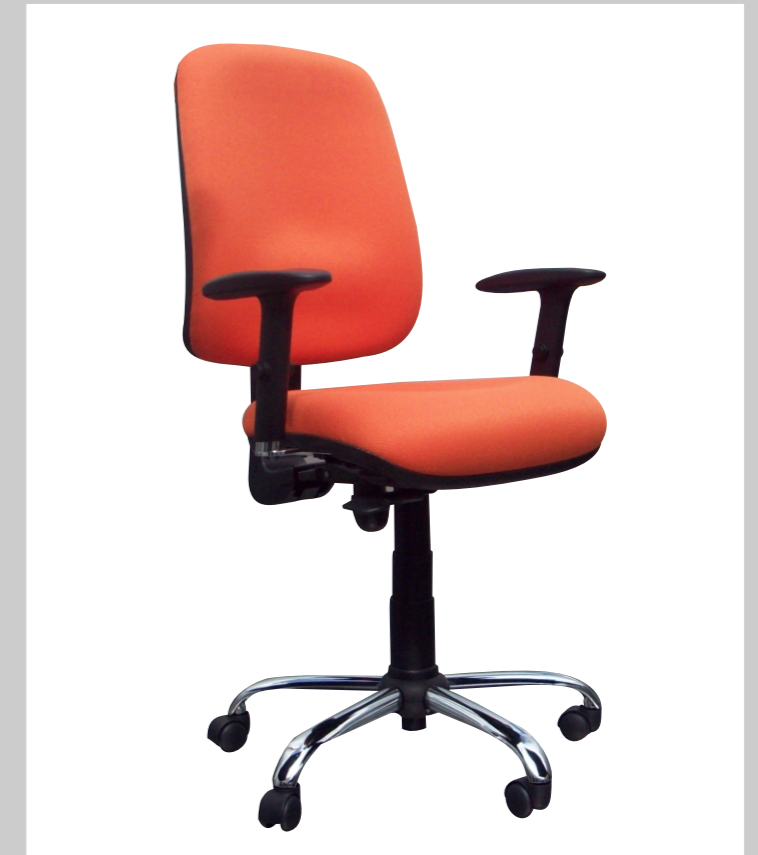
QS 800 AR

Espumas moldeadas: Asiento: espuma inyectada densidad 55 kg/m 3 , espesor 8 cm. Espaldar: Espuma laminada densidad 40 Kg/m 3 , espesor 5 cm; de alta duración, copian perfectamente la forma del cuerpo, dando mayor comodidad y evitando el cansancio en largas jornadas de trabajo.