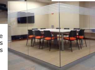
Proyecto: Universidad de los Andes

Líneas de estaciones de trabajo que permiten innumerables combinaciones según las necesidades específicas del cliente.